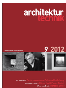
architektur+technik Die Schweizer Baufachzeitschrift für Planung und Ausführung