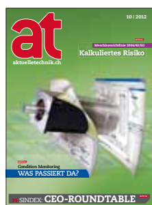
at – aktuellertechnik.ch Die Schweizer Fachzeitschrift für Industrie-Elektronik und Automation