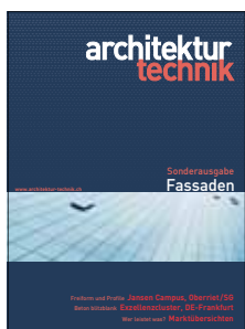
Fassaden Sonderausgabe der Zeitschrift architektur+technik