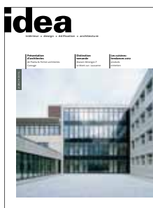
idea La revue pour la planification et la construction/Die Zeitschrift für Planen und Bauen