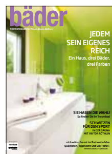
bäder Sonderausgabe der Zeitschriften architektur+technik und traumhaus