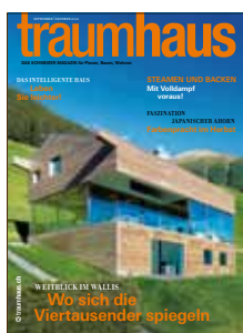
traumhaus Das Schweizer Magazin für Planen, Bauen, Wohnen