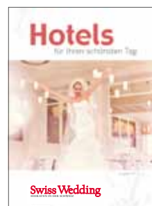
Swiss Wedding Hotelguide Hotels für Ihren schönsten Tag