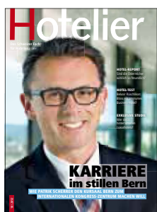
Hotelier Das Schweizer Fachmagazin für Hotellerie und Gastronomie