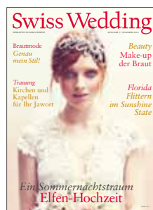
Swiss Wedding Heiraten in der Schweiz