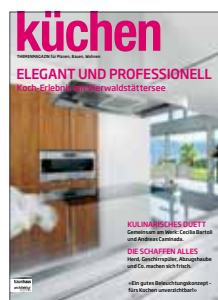
küchen Sonderausgabe der Zeitschriften architektur+technik und traumhaus